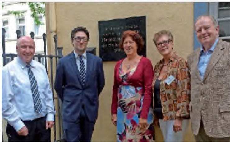
Der Vorstand der Förderer des Mutter-Beethoven-Hauses wurde im Amt bestätigt.