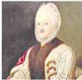
Fürstäbtissin Maria Kunigunde von Sachsen.

Die Spuren von Prinzessin Maria Kunigunde, der Schwester des letzten Trierer Kurfürsten Cle-