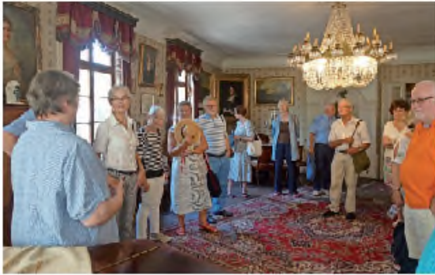
Die Förderer Mutter-Beethoven-Haus im Brentano-Haus.

Ehrenbreitstein. Oestrich-Winkel bot den reiselustigen und der enormen Hitze trotztenden Förderern des Mutter-Beethoven-Hauses ein ideales Ausflugsziel: nach dem Besuch des Brentanohauses mit einer interessanten Führung und vielen Informationen durch Baronin Angela von Brentano - auch zu Clemens von Brentano - waren die kühlen Keller des Wein-