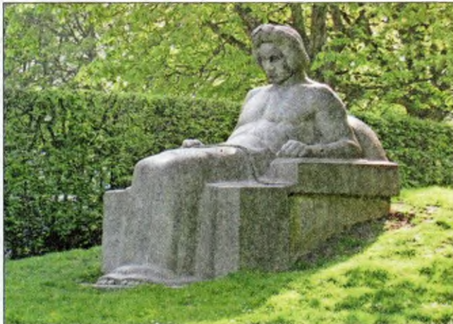
Peter Christian Breuer (1856 – 1930), Beethoven-Sitzplastik in der Bonner Rheinaue, 1938. Foto: Matthias von der Bank, 2017

Koblenz. Die Sonderausstellung im Museum Mutter-Beethoven-Haus, die vom 5. November bis zum 28. April 2024 läuft, widmet sich den Denkmälern von Ludwig van Beethoven, die in verschiedenen Teilen der Welt errichtet wurden. Solche Ehrungen für bedeutende Künstler und Musiker sind in Europa seit dem 18. Jahrhundert populär. Beethoven, der von 1770 bis 1827 lebte, gehört zu den besonders häufig gewürdigten Persönlichkeiten in dieser Hinsicht. Die erste Ehrung in Form eines Monuments für Beethoven wurde 1845 auf dem Münsterplatz in Bonn enthüllt. Das Denkmal folgt einem schlichten und zurückhaltenden Stil, typisch für bürgerliche Monumente jener Zeit. Beethoven ist in zeitgenössischer Kleidung dargestellt und steht auf einem hohen Sockel, der mit allegorischen Reliefs geschmückt ist. In der zweiten Hälfte des 19. Jahrhunderts entstanden