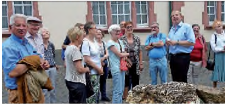
Die Förderer des Mutter-Beethoven-Hauses in Traben-Trarbach.

Ehrenbreitstein. Eine Kulturfahrt nach Traben-Trarbach? Sicher des Jugendstils wegen? Die wissensdurstige Gruppe der Förderer Mutter-Beethoven-Haus erlebte jedoch in erste Linie das Museum im vollständig erhaltenen und möblierten Barock-Haus der Unternehmer-Familie Böcking.