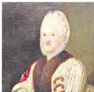
Fürstäbtissin Maria Kuni- gunde von Sachsen.

Die Spuren von Prinzessin Maria Kunigunde, der Schwester des letzten Trierer Kurfürsten Cle-