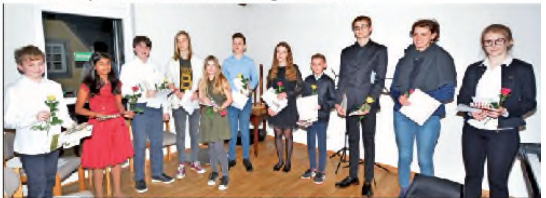
Alle Teilnehmer erhielten vom Verein FMBH eine Urkunde zu ihrem Auftritt, CDs und einen kleinen Obolus